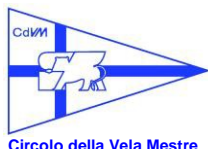
Circolo della Vela Mestre